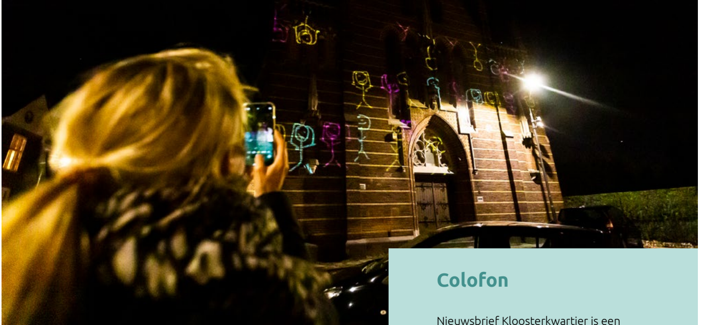
Het verhaal op mobiel, het beeld op gevels.

De 'beeldende audioroute THUIS' in en om het Kloosterkwartier maakte veel los bij de deelnemers. De wandeling vormde de afsluiting van Kunstproject het Kloosterkwartier.